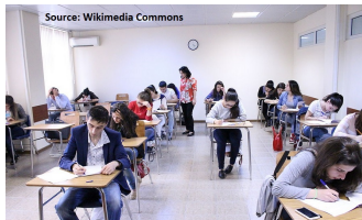
Prova com consulta