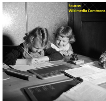
Exercício para casa