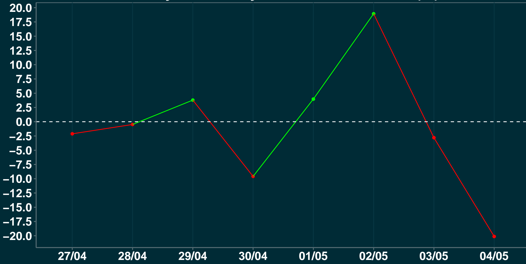
Variação em relação a semana anterior (%)