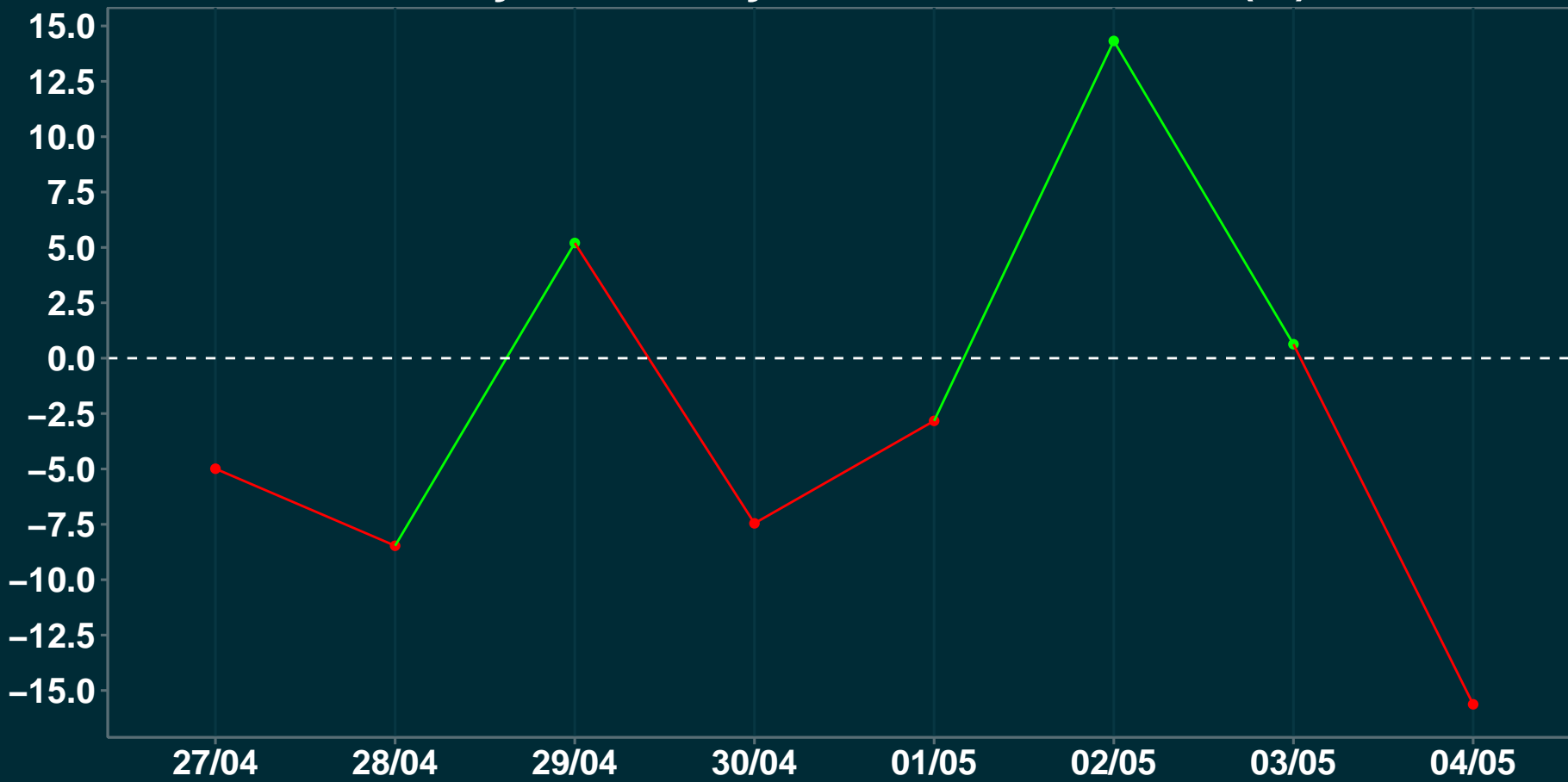
Variação em relação a semana anterior (%)