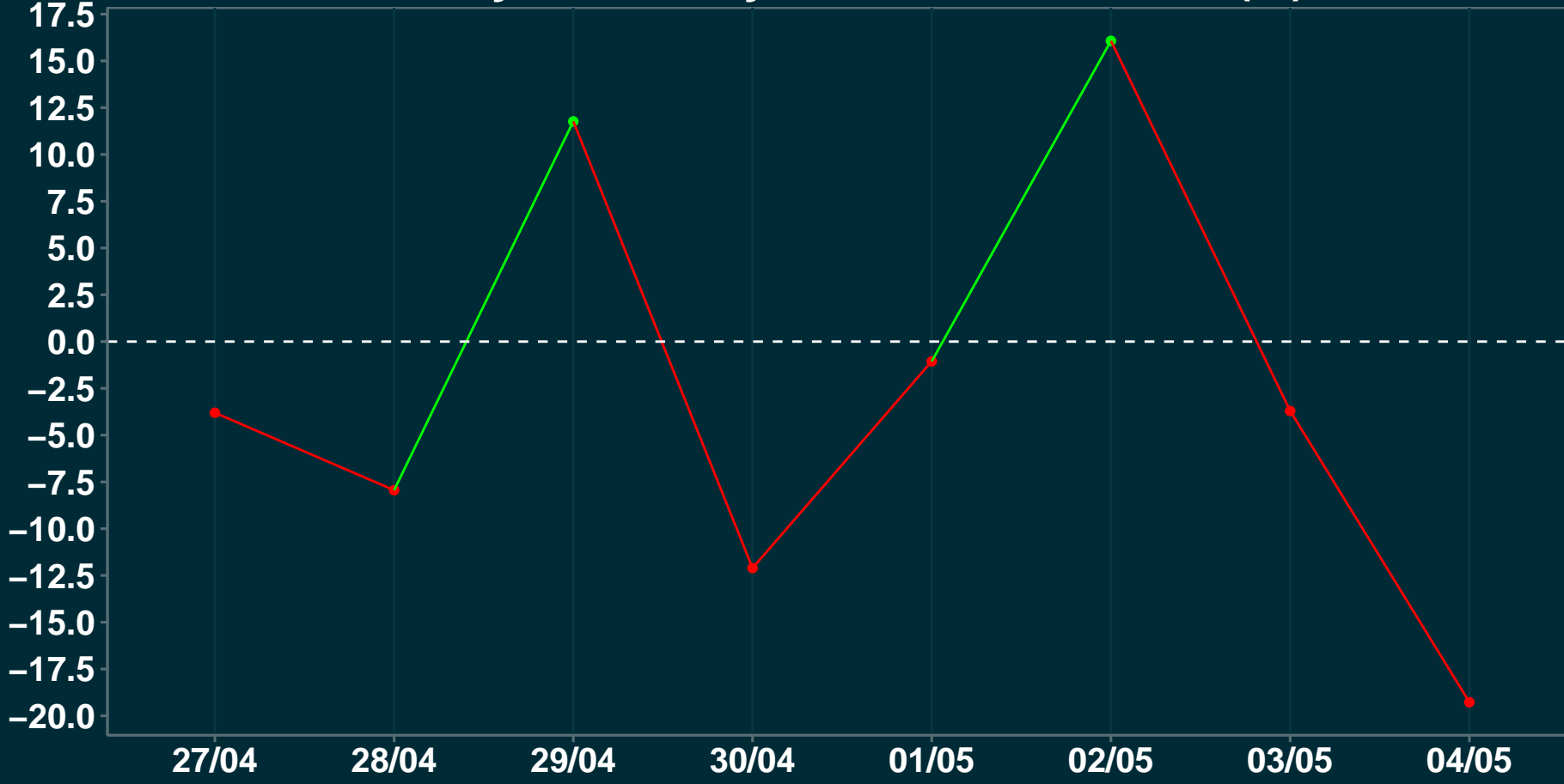
Variação em relação a semana anterior (%)